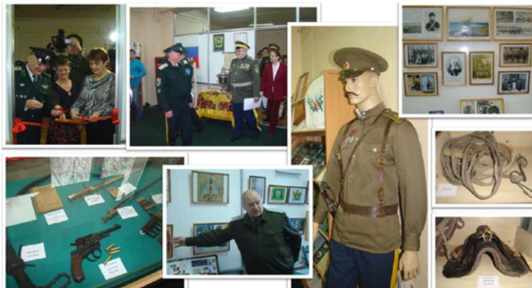
Историко-краеведческая коллекция «Амурское казачество: вчера и сегодня»