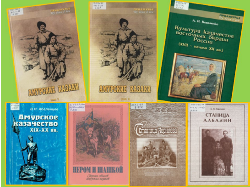
Издания по истории и деятельности амурского казачества