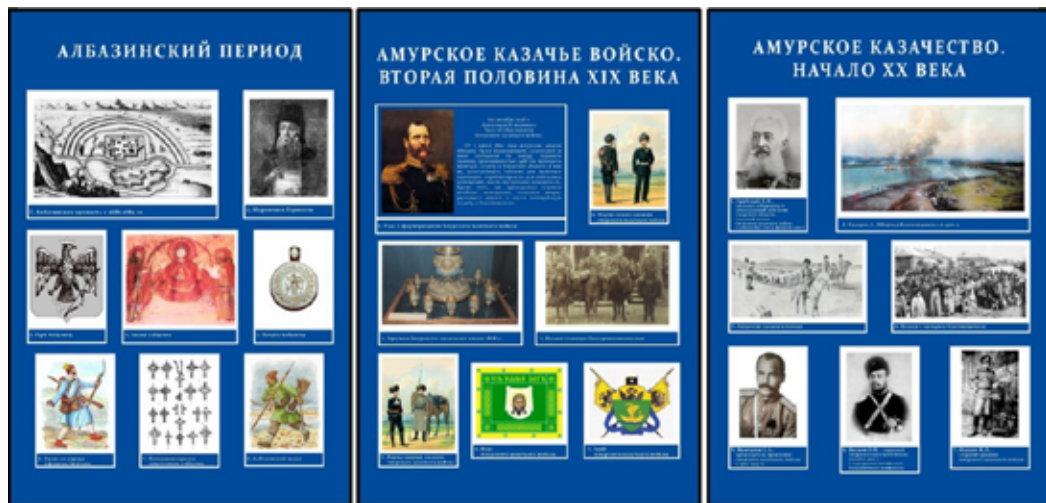
Исторические периоды коллекции

«Третий возраст» регионального отделения Союза пенсионеров России, студенты вузов Благовещенска, учащиеся средних специальных учебных заведений города, школьники и даже воспитанники детского сада.