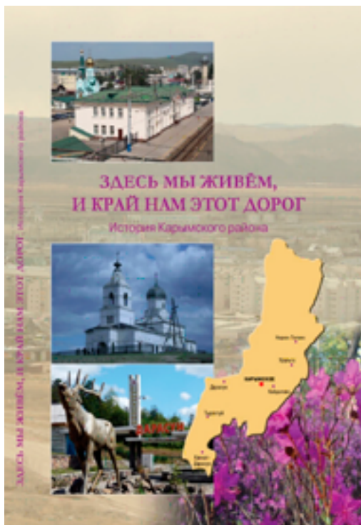
Обложка книги «Здесь мы живем, и край нам этот дорог» (сост. Т. В. Мухамедьярова, Улан-Удэ, 2019 год).

Исследования истории сёл Карымского района Забайкальского края вошли в книгу «Здесь мы живем, и край нам этот дорог: история Карымского района» [6], вышедшую в 2019 году благодаря Фонду президентских грантов.