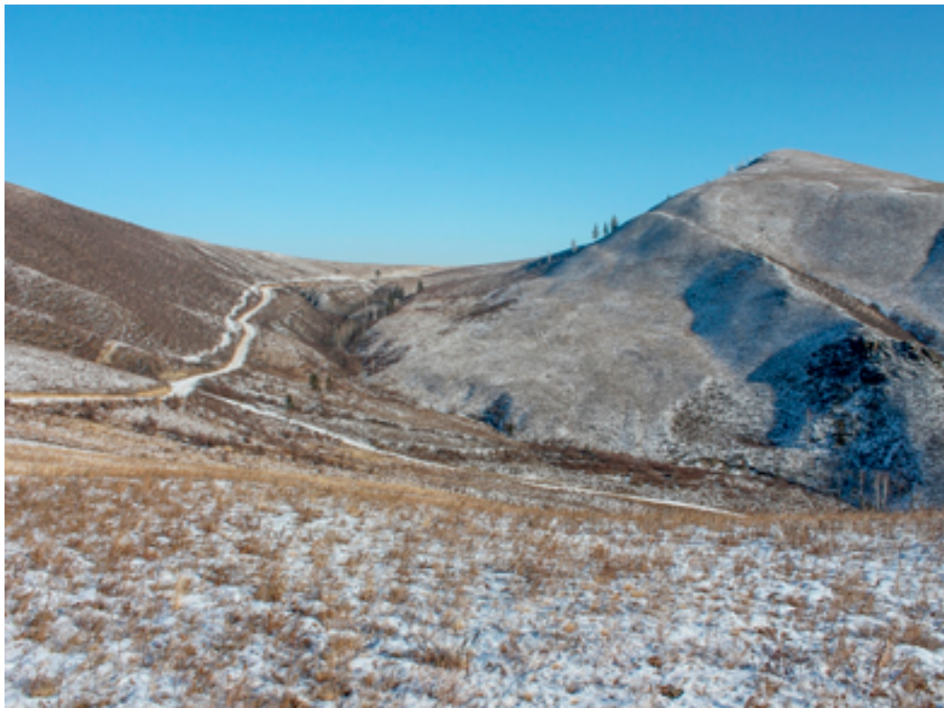
Московский тракт. Луковая сопка.

Забайкалье учёный, путешественник П. А. Кропоткин. Весной 1863 года он сплавился по этим рекам до Сретенска, проводя научные исследования. Немного исследователей, вплоть до наших дней, прошли путями П. А. Кропоткина. Его сибирские работы быстро стали известны за границей. Геолог Эдуард Зюсс ссылается на них неоднократно в своём классическом многотомном труде «Лик Земли».