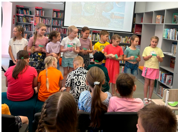
Библиотека семейного чтения МБУК ЦБС г. о. Чапаевск Самарской области. Игровая программа «Путешествие в страну Читалию»