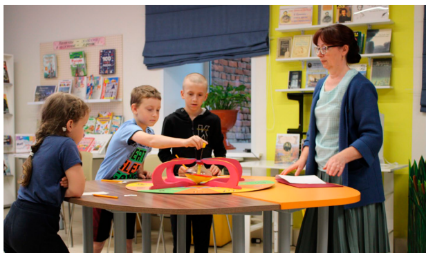
МБУК «Пошехонская ЦБС», модельная детская библиотека. Литературная игра «В волшебной пушкинской стране»

литературный проект «Тебя, как первую любовь, России сердце не забудет» 1 . Целью проекта стало сохранение и популяризация литературного наследия великого поэта, актуализация его творчества для современной аудитории и укрепление роли библиотеки как центра культурной жизни района.