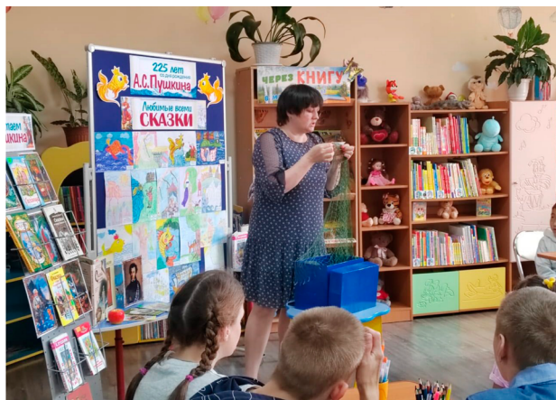
Просветительское мероприятие проекта «Тебя, как первую любовь, России сердце не забудет». МБУК «Тымовская ЦБС», детский отдел центральной районной библиотеки. Литературная игра «Сказочное Лукоморье»

2024 год был ознаменован значимой для всей российской культуры датой — 225-летием со дня рождения Александра Сергеевича Пушкина. В рамках празднования этой даты коллектив муниципального бюджетного учреждения культуры «Тымовская централизованная библиотечная система» (МБУК «Тымовская ЦБС») инициировал и успешно реализовал масштабный