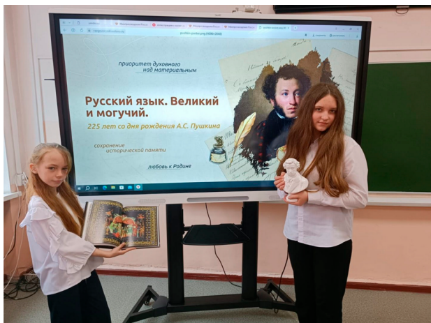
МБОУ СОШ № 3 пгт Тымовское. Литературный урок «Разговор о важном. Мир великого поэта»

от дошкольников до людей старшего поколения.