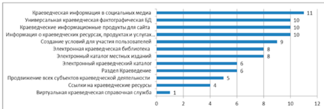
График 1. Отражение основных краеведческих ресурсов, рекомендуемых «Руководством по краеведческой деятельности...», на сайтах центральных библиотек ДФО.

Всего было выявлено 224 наименования условных информационных продуктов (ресурсов) краеведческой тематики, включая разделы, подразделы сайтов, проекты, выставки и пр. (приложение 3). Ориентируясь на их содержание, мы попытались сгруппировать их по направлениям (график 2). Таким образом, было установлено, что треть ресурсов (31,7%) отражает историческое направление, четверть (25,9%) — универсальное. Весомая часть посвящена литературному направлению (19,2%) и культурному (18,3%). Значительно меньшим числом представлены экологическое (2,6%), научное (1,3%) и правовое (0,9%) направления. Следует ещё раз сделать оговорку, что в данном случае деление по направлениям носит условный и в какой-то мере субъективный характер.