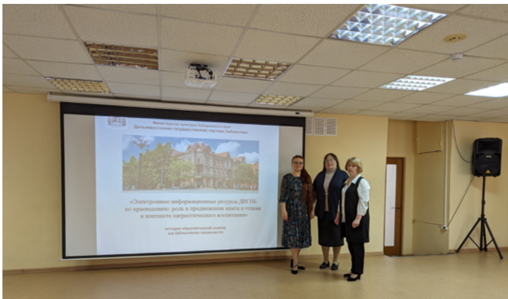
Сотрудники ДВГНБ — ведущие методико-образовательного семинара

Патриотическое воспитание подрастающего поколения всегда выступало важным направлением в работе библиотек. Детство и юность — самая благодатная пора для привития священного чувства любви к Родине. Библиотеки используют различные формы работы: от межрегиональных и региональных научно-практических форумов, конференций, семинаров, круглых столов до небольших полочных выставок, активно взаимодействуют с образовательными учреждениями, общественными организациями.