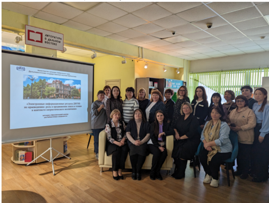
Участники и ведущие семинара в посёлке Эльбан

Выступления специалистов ДВГНБ по актуальной тематике и примеры из практики работы с интересом были восприняты собравшейся аудиторией. Программа семинара была рассчитана на три часа. В завершение был проведён круглый стол, где библиотечные специалисты обменялись практическими навыками применения электронных информационных ресурсов по краеведению в патриотическом воспитании, ведь их на сайте ДВГНБ размещено около 30, и эта коллекция постоянно пополняется. Большинство из них создано при грантовой поддержке различных фондов. Чтобы воспользоваться краеведческими ресурсами, нужно зайти на сайт ДВГНБ https://www.fessl.ru/ , в меню зайти в «Ресурсы», затем в «Электронные ресурсы» и в выпадающем меню зайти в «Краеведение». Откроется список всех электронных краеведческих ресурсов: