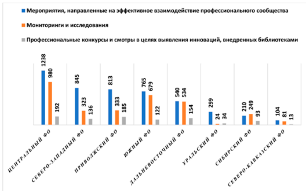
Диаграмма 1. Количество профессиональных мероприятий, проведённых в 2022 году

Данные мероприятия отличаются огромным разнообразием видов и форм, они проводились на разных уровнях (от международного до муниципального) и для различных возрастных и профессиональных групп