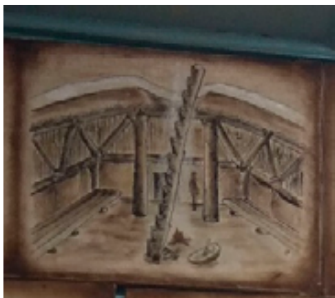
Рисунок из книги Свена Вакселя, воспроизведённый на стене частного этнографического музея. Камчатка, село Мильково, лето 2019 года.

б) подземное зимнее жилище камчадалов: вход через верхний лаз, спуск по длинной приставной лестнице (бревно с зарубками), в центре — очаг, по периметру — каны с подогревом, деление на женскую и мужскую половины с сакральным центром. Стены укреплены фахверком из брёвен.