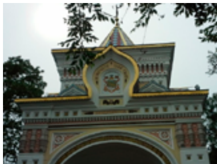
Манифестация русского стиля на берегах Амурского залива. Деталь реконструированной триумфальной арки (1891 г., реконструирована в 2003 г.). Владивосток, июнь 2019 года

Мы так подробно останавливаемся на символических объектах, генерирующих основные культурные поля, потому что с распадом единого архитектурного стиля (государственного ампира) постсоветские городские пространства утратили чёткую иерархичность. Прибегая к литературной метафоре, вряд ли уместной в академическом формате, можно сказать, что верхний, привычный и понятный, слой городского палимпсеста полустёрт и сквозь него всё отчетливее сквозят более ранние пласты. При этом поверх существующего нарратива постоянно дописываются и переписываются новые строки и абзацы, что затрудняет расшифровку культурного ландшафта, сбивает «настройки» коллективного подсознания и ослабляет связь с привычной средой обитания.