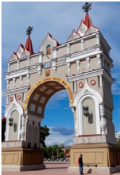
Реконструированная триумфальная арка (1891 г., реконструирована в 2003–2005 гг.). Благовещенск, сентябрь 2019 года.

Самый масштабный пример русского стиля на Дальнем Востоке — Торговый дом «Кунст и Альберс» (1894 г., арх. Э. И. Шеффер) — расположен в Благовещенске на ули-