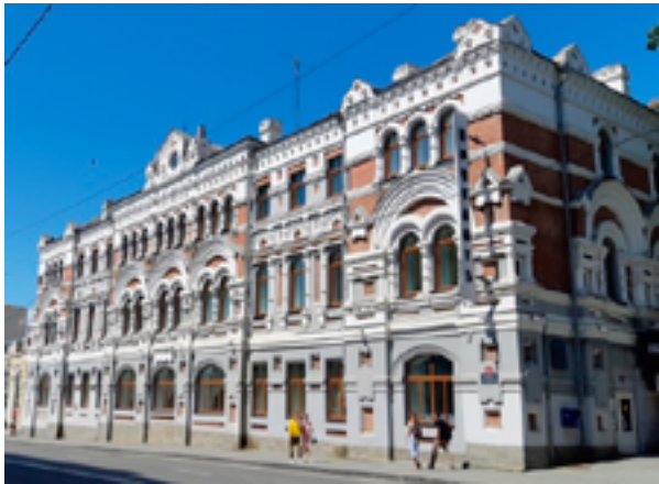
Манифестация русского стиля на берегах Амурского залива. Здание Владивостокской почтово-телеграфной конторы, 1897–99 годы, арх. А. Гвоздиковский, ул. Светланская, 4. Владивосток, июнь 2019 года

покровителям города, открытый в июне 2005 года в рамках празднования 300-летия принятия православия на Камчатке. В Хабаровске стела установлена на улице Тургенева, рядом с новым Успенским собором. Во всех трёх городах стела, маркирующая присутствие государства, служит символическим посредником между «национальным» (православным) и «народным».