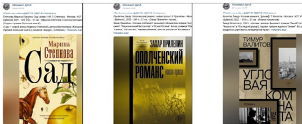
Примеры постов о новинках отдела «Абонемент».

Помимо этого, информация о новинках размещается на страницах отдела в социальных сетях: в «Одноклассниках» и во «ВКонтакте». Один раз в неделю публикуются материалы под хэштегом #ТвойкнижныйшкафДВГНБ, с краткой информацией о новинках. Один пост — одна книга.